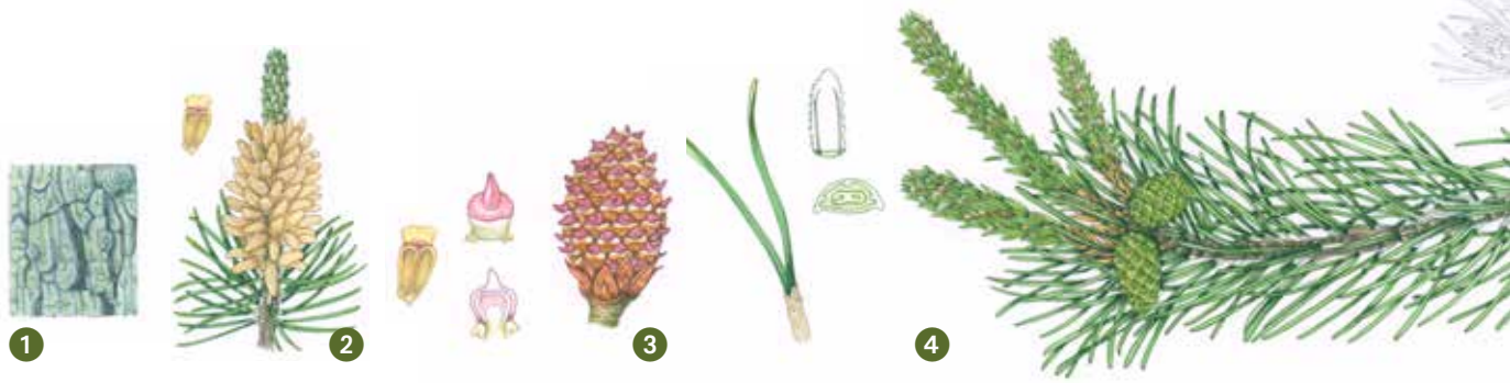
1. Barken är gråbrun. 2. Hanblomman är gulaktiga och cylindriska. 3. Honblomman är gulgröna till violetta. Kottarna är blanka. Varje kotte har mellan 50–70 frön. 4. De gröna barren varierar i längd från cirka två till sju centimeter.